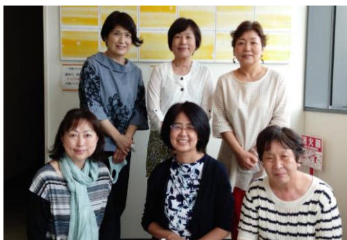
よろしく願います(^_^)

★コロナ禍の厳しい状況ではありますが、安全対策に配慮し、皆様楽しんでいただける会にしたいと考えております。