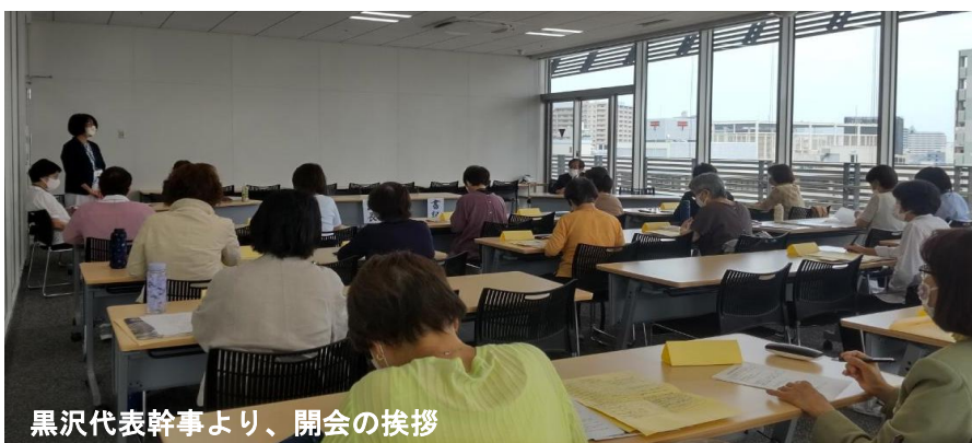
黒沢代表幹事より、開会の挨拶